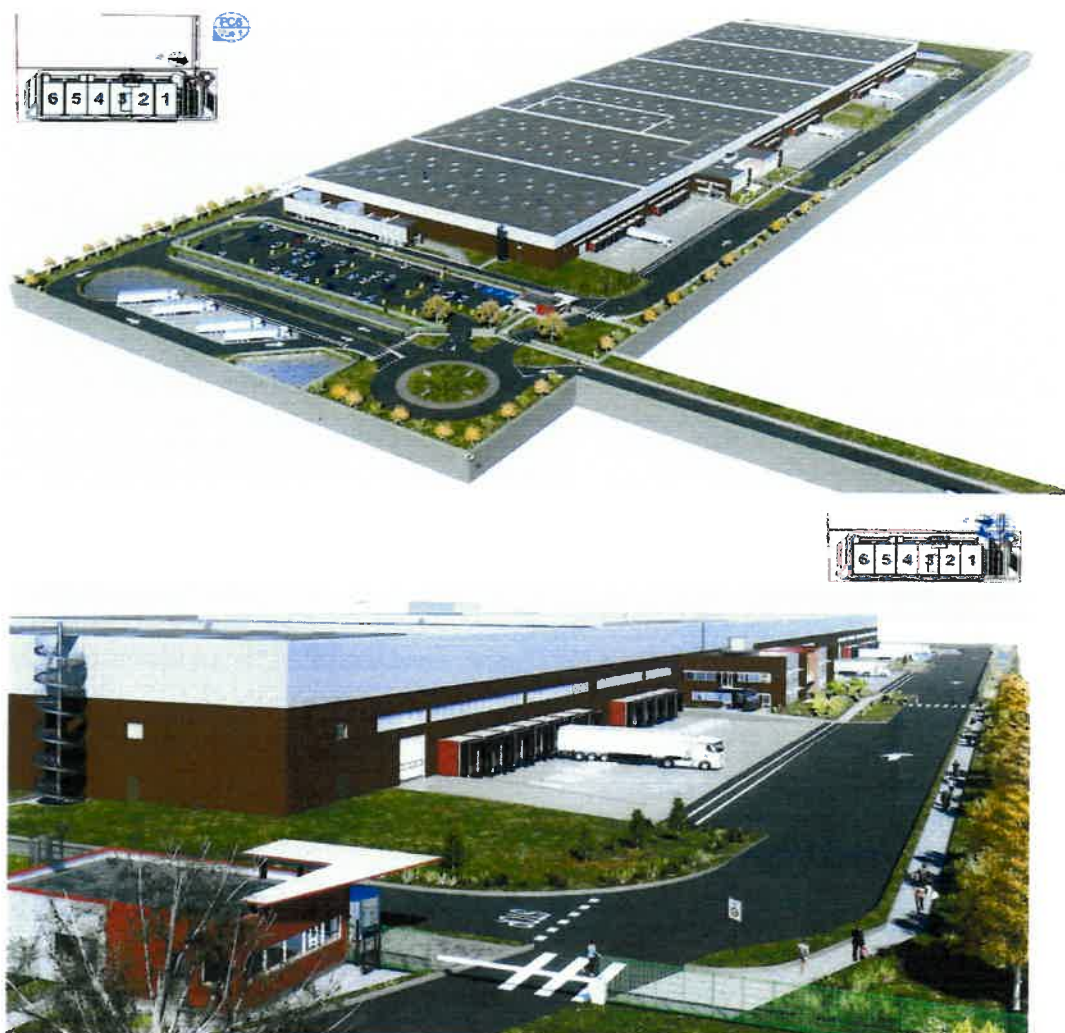
Vue d'ensemble de l'entrepôt

L'accès au terrain se fera au Sud-est du site pour l'ensemble des véhicules.